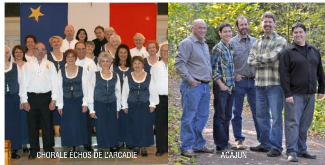
CHORALE ÉCHOS DE L'ARCADIE